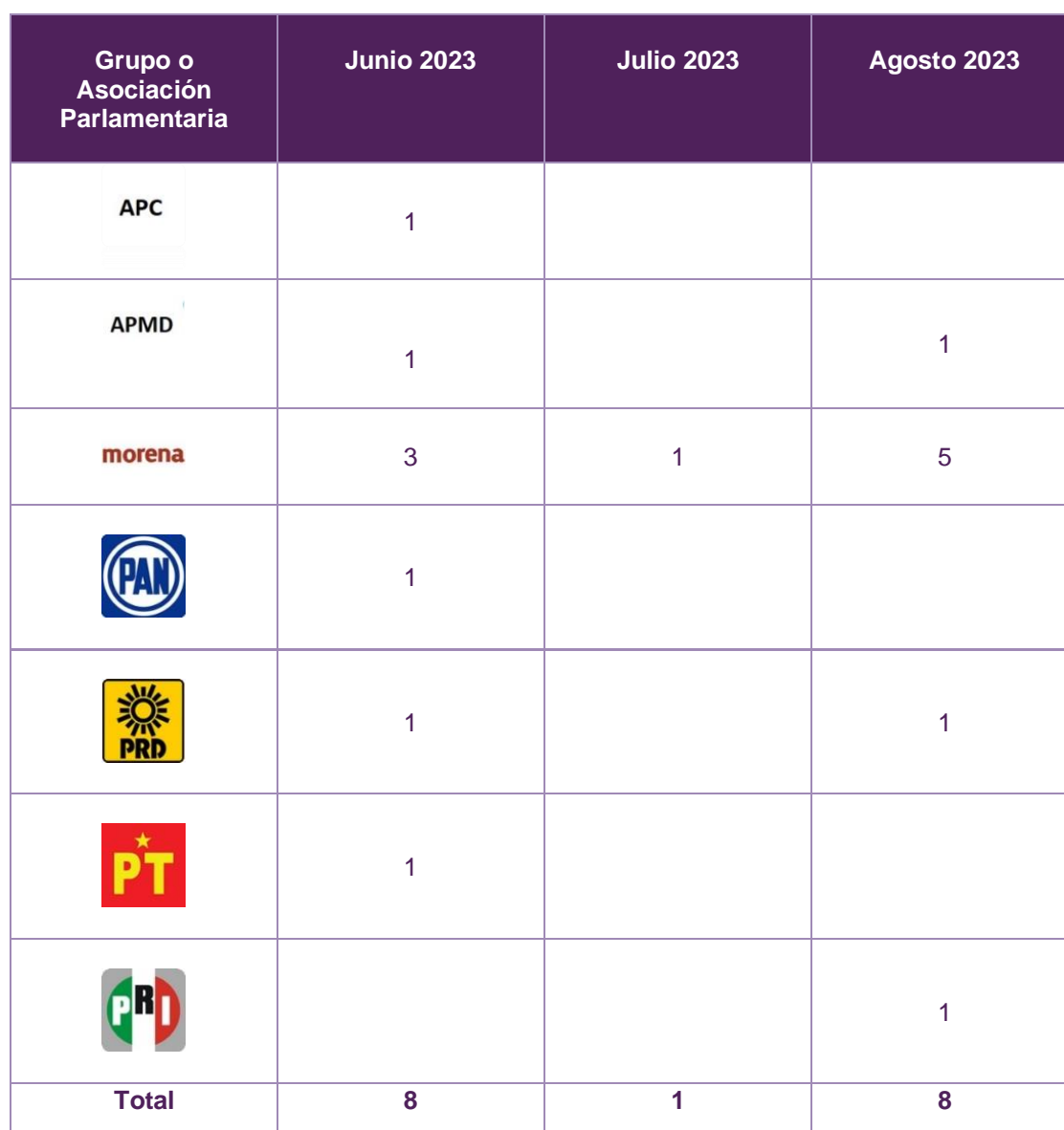
Tabla 2. Iniciativas que abordan aspectos de derechos humanos de las mujeres e igualdad de género por los grupos y asociaciones parlamentarias.

Se desprende que las diputadas presentaron 9 iniciativas, mientras que los diputados presentaron 8 iniciativas que abordan algún aspecto de derechos humanos de las mujeres o igualdad de género.